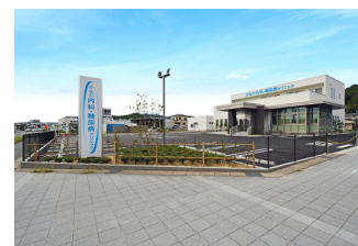
かなだ内科・糖尿病クリニック 外観